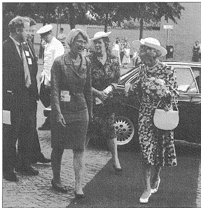
H.K.H. Dronning Ingrid ankommer til åpningen av kongressen